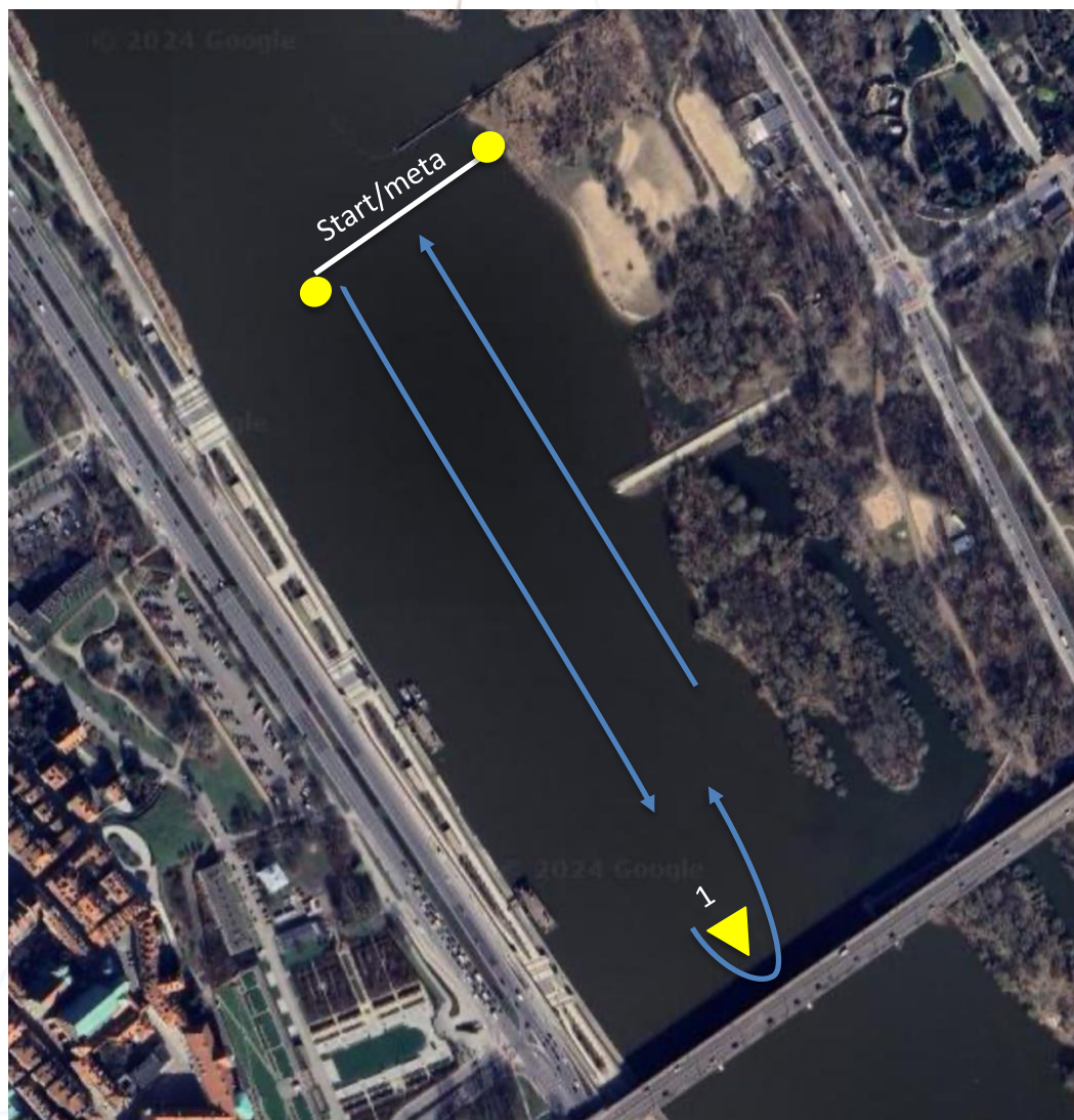
Trasa: START - 1 - META

W przypadku braku warunków wiatrowych i meteorologicznych rozegrane zostaną wyścigi pokazowe, szczegóły zostaną podane w komunikacie.